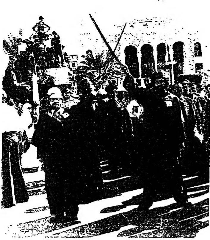
شباب في ازياء رجلي دين يملأون الوحدة الوطنية بل شرارة تخلق ذنوباً واعية لكل مواطن يكون مسؤولاً عن بيته وشارعه وجهه ومجتمعه.

وتابع قائلاً: لقد عرفنا هذه المدينة الطيبة وعرفنا ما في نفوس أبنائها من تيم وبطولات ومغامير، ذلك لآثرى كثيراً على طوبى طرابلس أن تتحول الى مدينة نظيفة، يتولى ابنائها القيام بالخدمة الزينية.